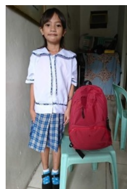
出生証明書を取得して学校へ通えるようになったJちゃん

お名前： ご住所： メールアドレス： ご寄付額／お礼品の有無： 円／ お礼品有・無