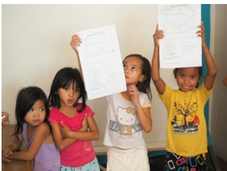
出生証明書を手に喜ぶ子どもたち

生まれたという証明がないために、学校に行くこともできず、正規の仕事に就くこともできず、そして病院で保険の適用も受けることができない。これまでの活動で私たちはそうした子どもたちに出会ってきました。クリスマスを迎える子どもたちに贈り物を、「生まれてきてくれてありがとう」を形にする活動に、ご支援をお願いします！